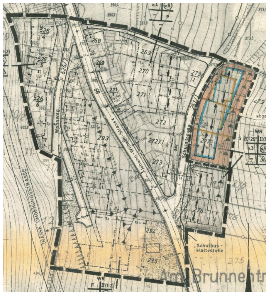
Abbildung des rechtskräftigen Bebauungsplanes „Brunnentrog“ – 1. Teiländerung

Die 1. Teiländerung stammt aus dem Jahr 1977 und umfasst die Flächen der Flurstücke Nr. 277 bis Nr. 279/3, für die mit diesem Verfahren nunmehr auch eine 3. Änderung des Planwerkes vorgenommen wird.